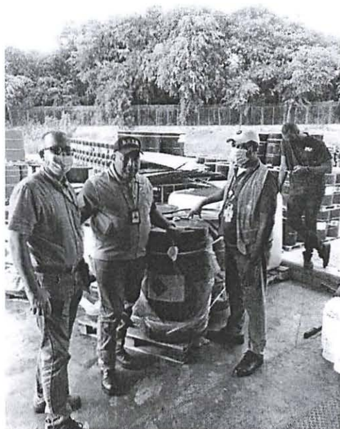
Toma de Muestra