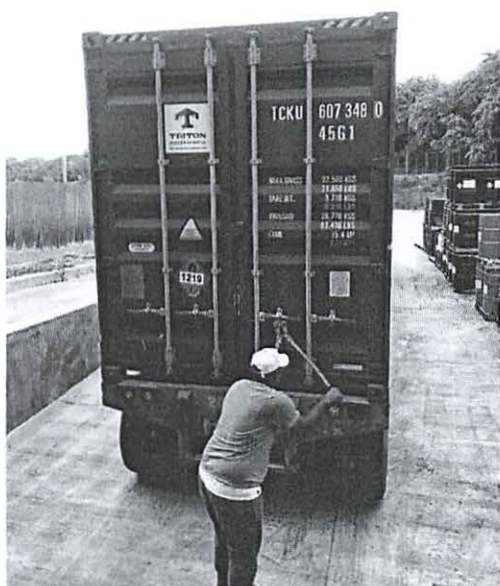
Apertura del Contenedor