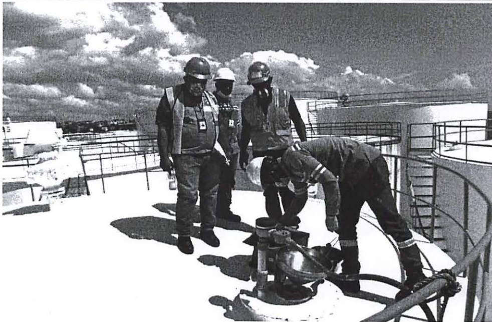
DESNATURALIZACION DE ALCOHOL ISOPROPILICO