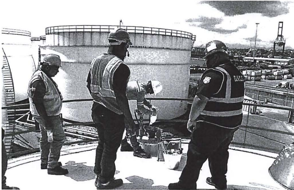
DESNATURALIZACION DE ALCOHOL METILICO