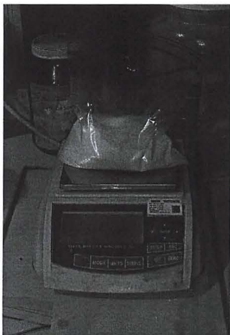
Pesaje de la Sustancia Desnaturalizante