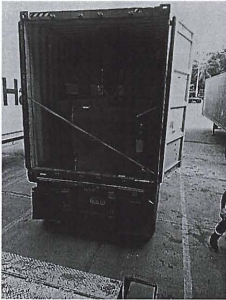
Proceso de Desnaturalización