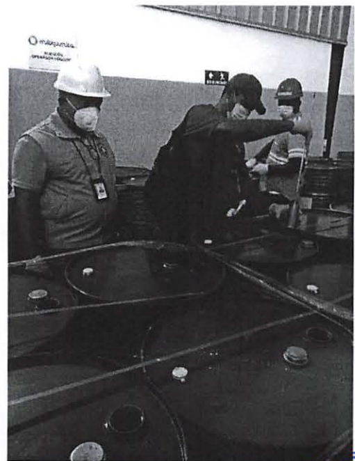
Toma de Muestra