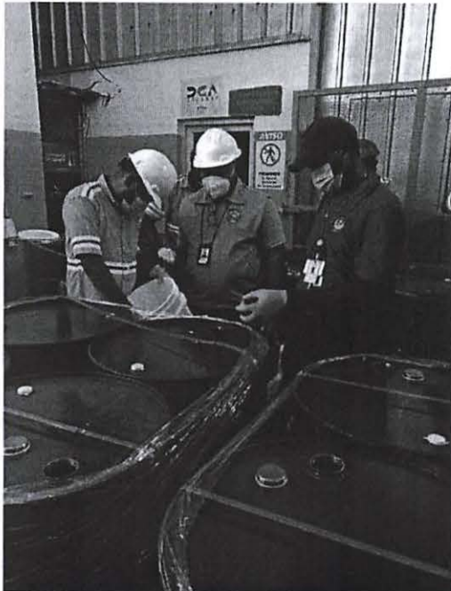
Proceso de Desnaturalización