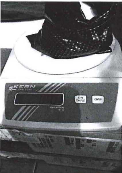
PESAJE Y DESNATURALIZACION