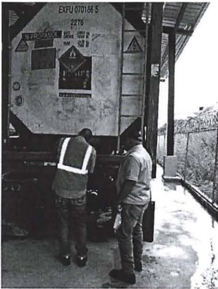
ISOTANQUE A VERIFICAR