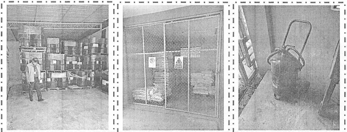
AREA DE ALMECEN